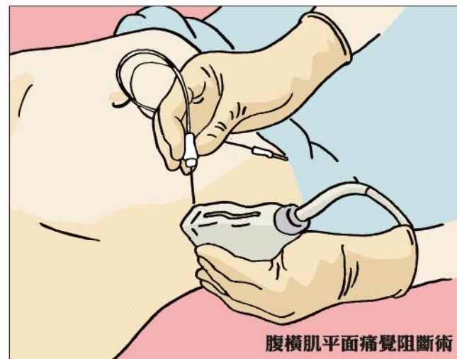
腹橫肌平面痛覺阻斷術

肢的運動功能，減少術中及術後嗎啡類止痛藥之需求，減少術後噁心嘔吐的副作用，提供腹部手術後有效的傷口減痛。